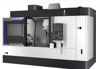
複合加工機 MULTUS B300 II