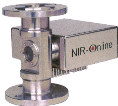
ガス、液体、ペースト用