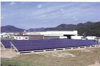
広い場所での設置