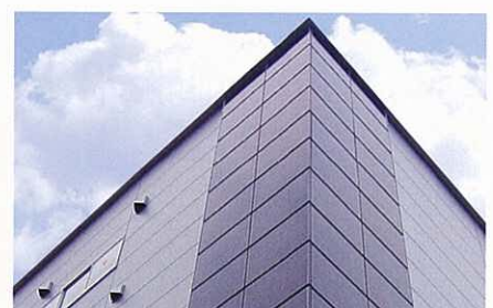
建物の壁面への設置