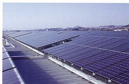
建物の屋根・屋上への設置